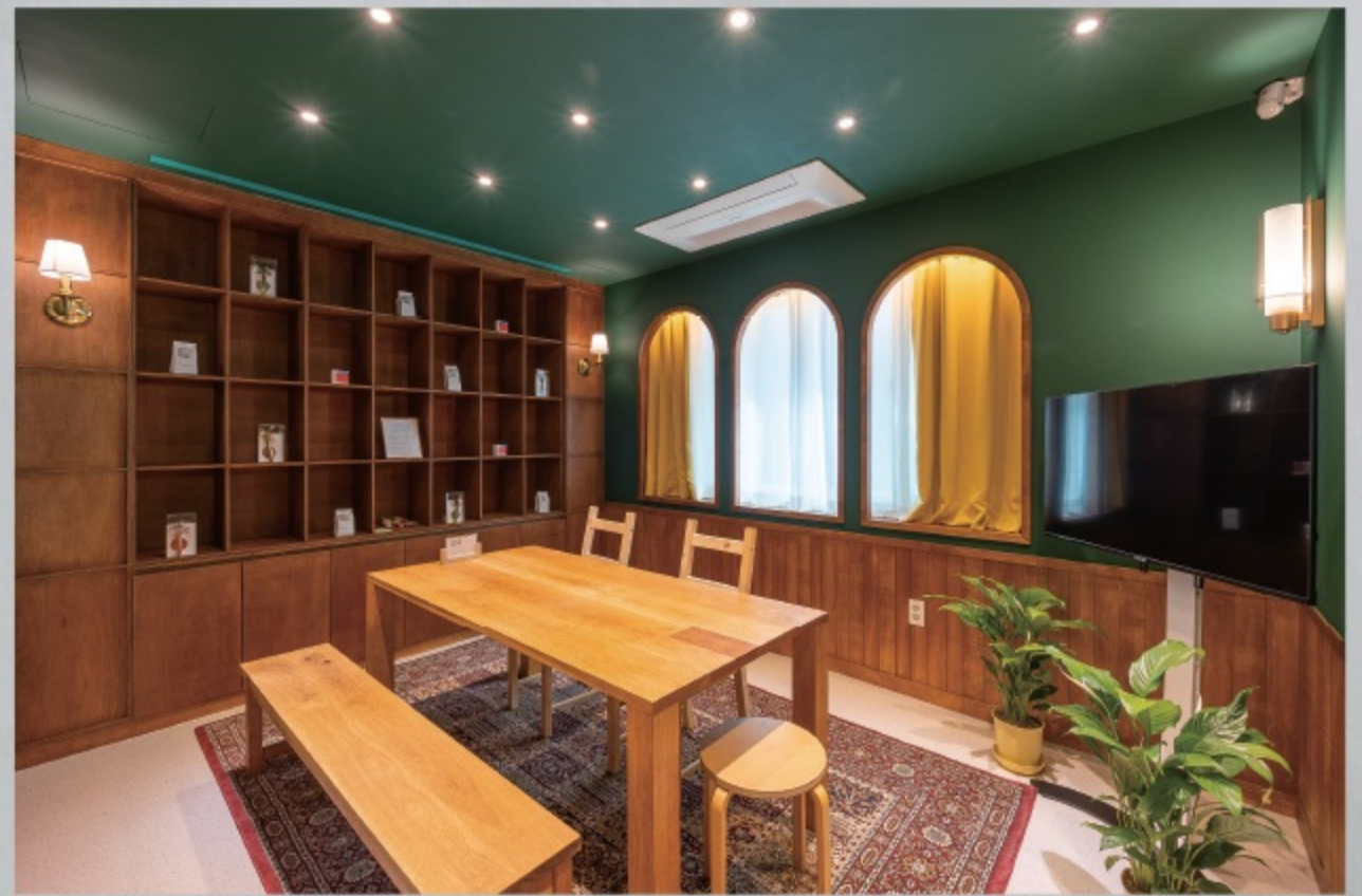
전환가게 : 아트살롱 썸